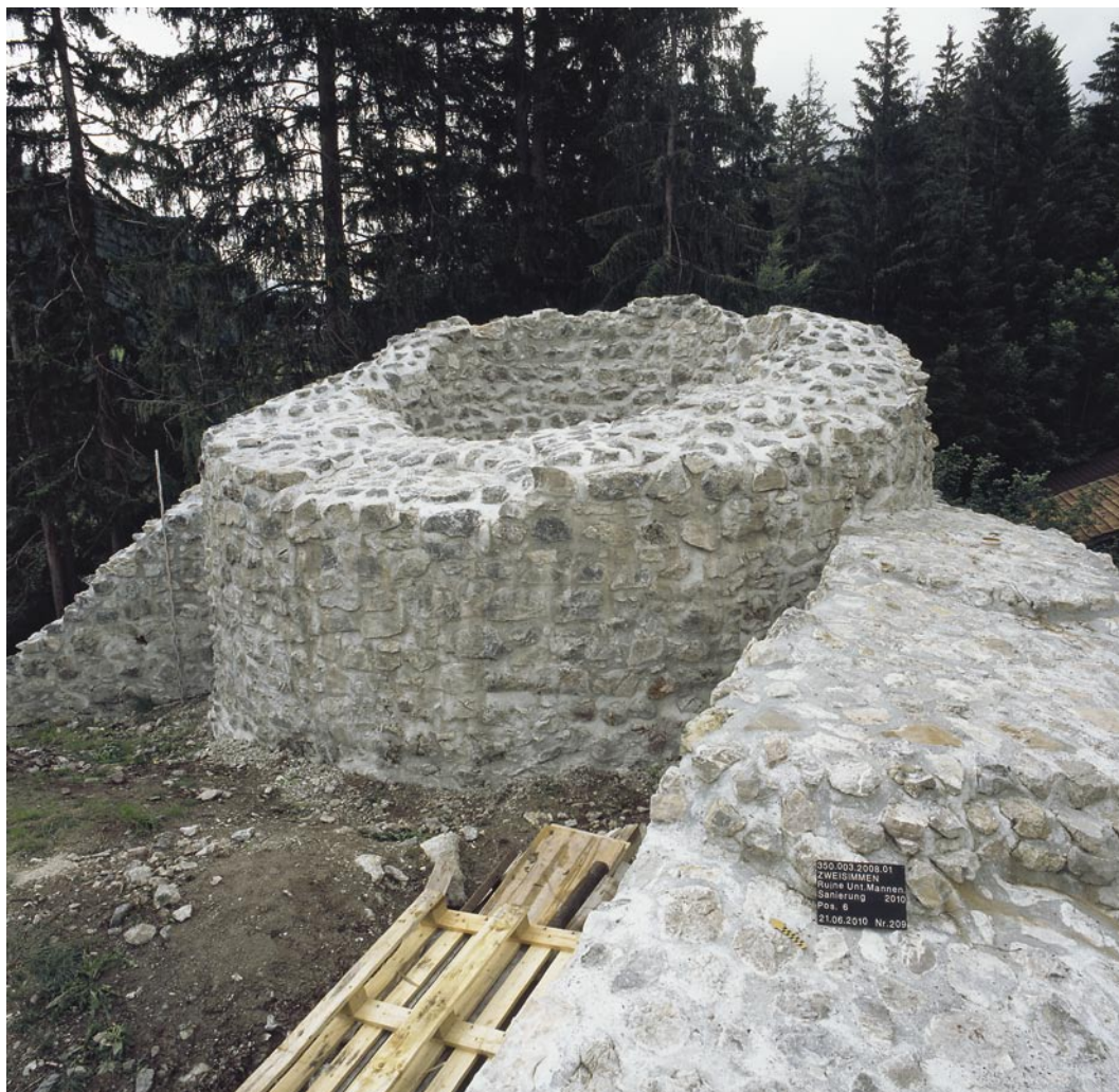
Abb. 7: Zweisimmen, Unterer Mannenberg. Der Rundturm der Phase II in restauriertem Zustand. Blick von Süden.