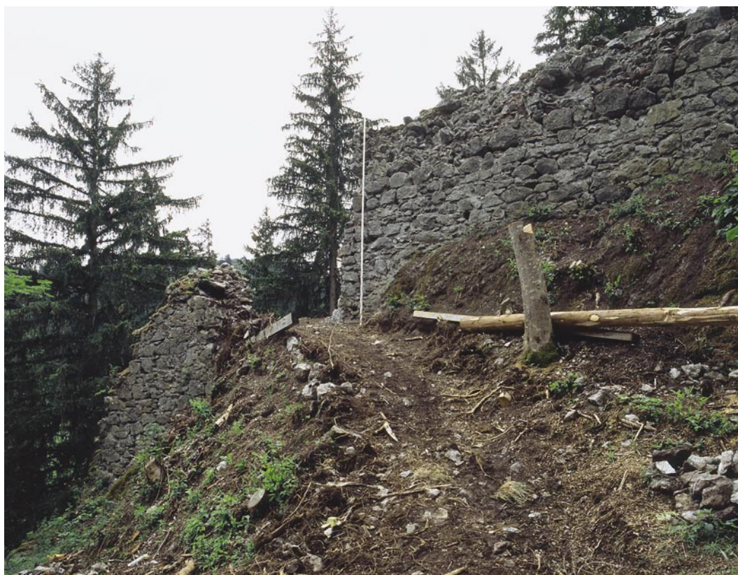
Abb. 6: Zweisimmen, Unterer Mannenberg. Die Reste des kleinen Portals in der östlichen Ringmauer; südlich davon fällt das Gelände steil ab, wie am Verlauf der Ringmauer gut sichtbar ist. Im Vordergrund die überwachsenen Reste der zum Portal führenden Rampe. Blick von Osten.

Im kleinen Burghof wurde die eine Seite eines Mauerzuges aufgedeckt, der mit einer Mauerstirn an der hofseitigen Fassadenmauer des Wohnbaus ansetzte und dann in einem Abstand von etwa 3 m mehr oder weniger parallel zur nördlichen Ringmauer verlief. Vermutlich handelt es sich um ein innen an die Ringmauer anlehnendes Gebäude, welches die Lücke zwischen dem mutmasslichen Turm und dem Wohnbau schloss und vielleicht als Verbindungsbau interpretiert werden kann. Möglich wäre auch, dass dieser Verbindungsbau und der mutmassliche Turm Teile ein und desselben Gebäudes sind, das dann einen L-förmigen Grundriss aufgewiesen hätte.