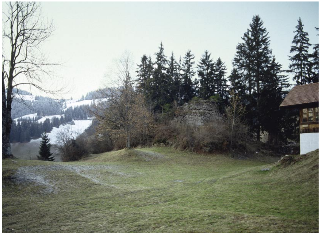
Abb. 1: Zweisimmen, Unterer Mannenberg. Der überwachsene Burghügel mit den Resten des Rundturmes im Jahr 1985. Blick von Nordosten.