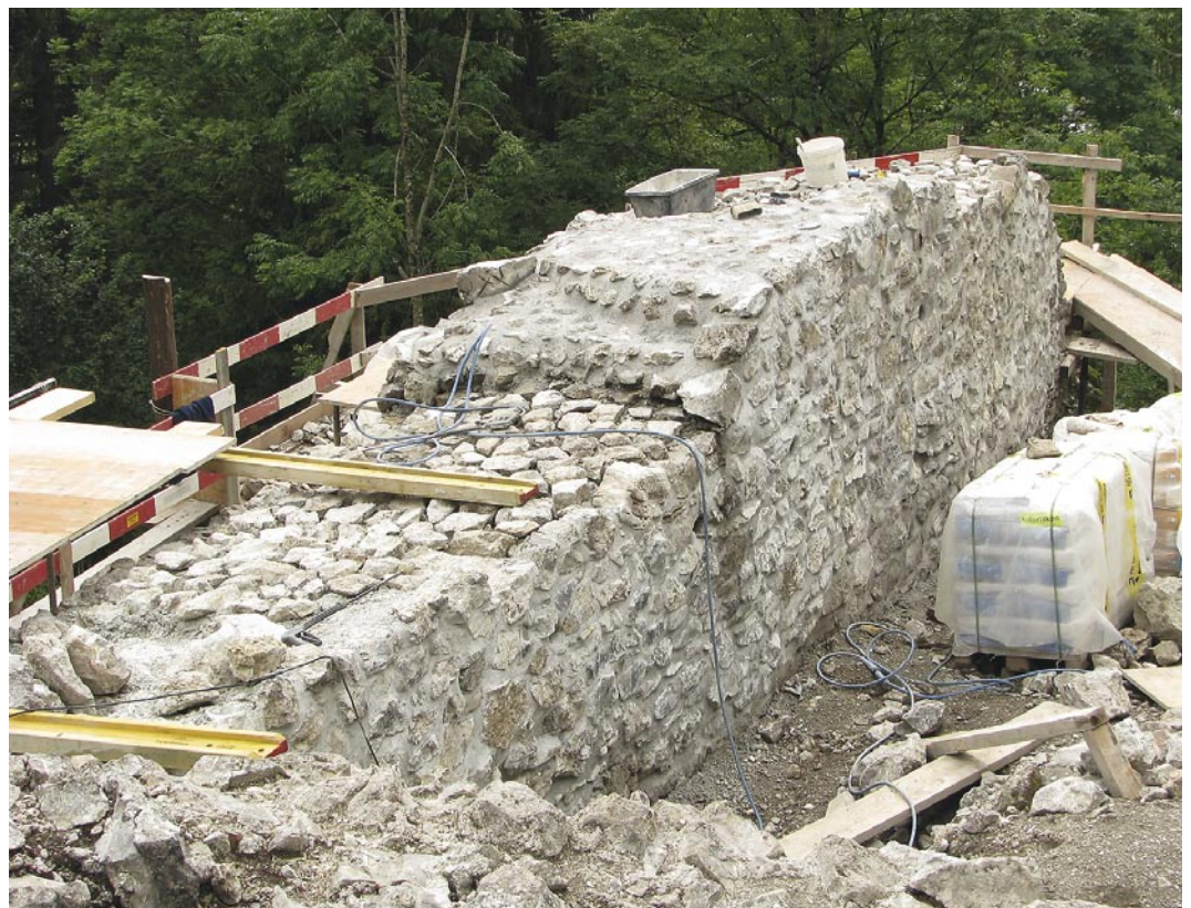
Abb. 5: Zweisimmen, Unterer Mannenberg. Wiederaufmauerung der obersten Mauerlagen. Blick auf die östliche Ringmauer von Norden.

Unmittelbar neben der Türnische setzt an der Innenseite der Ringmauer mit einem Winkel von 45° eine rund 1 Meter starke Mauer an, die auf die Südostecke des Wohnbaus zielte und so den oberen kleinen Burghof abschloss. Der Weg vom Aussentor ins Burginnere führte diese Mauer entlang. Da das Gelände unmittelbar südlich steil abfällt, hatte dieser Weg die Form einer aufgeschütteten Rampe, die mit einer talseitigen Stützmauer gesichert war. Auf dieser Rampe gelangte man wahrscheinlich durch ein weiteres Tor in den kleinen Burg-