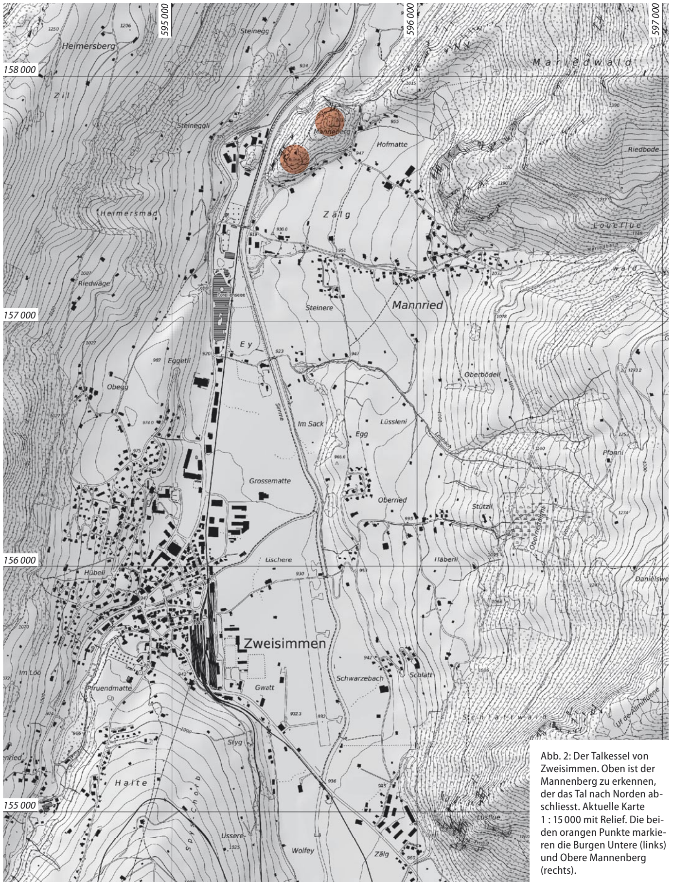
Abb. 2: Der Talkessel von Zweisimmen. Oben ist der Mannenberg zu erkennen, der das Tal nach Norden abschliesst. Aktuelle Karte 1 : 15 000 mit Relief. Die beiden orangen Punkte markieren die Burgen Untere (links) und Obere Mannenberg (rechts).